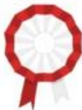
kotylion w barwach Polski